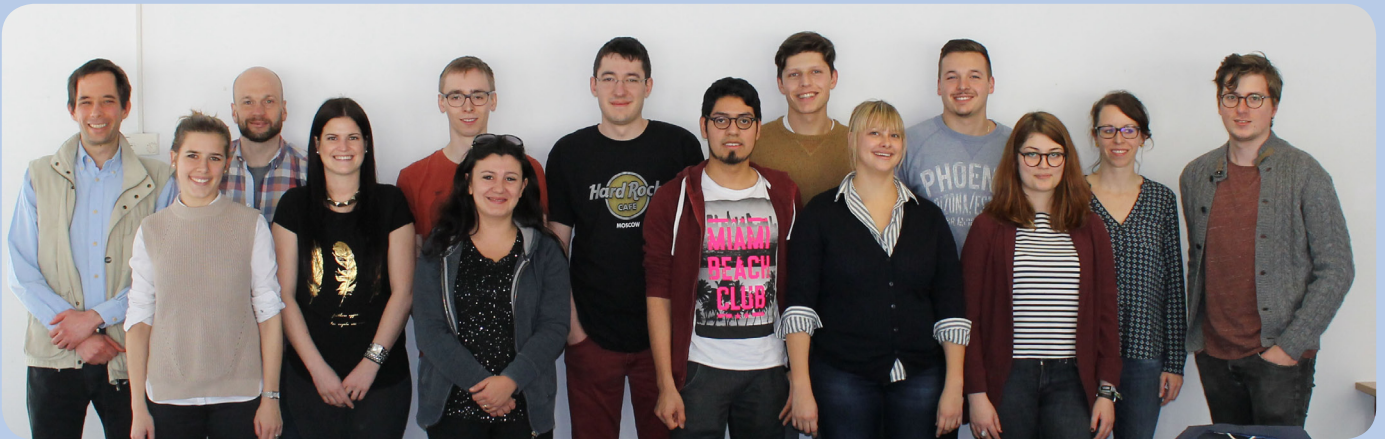
Bureau Exécutif 2016 - 2018