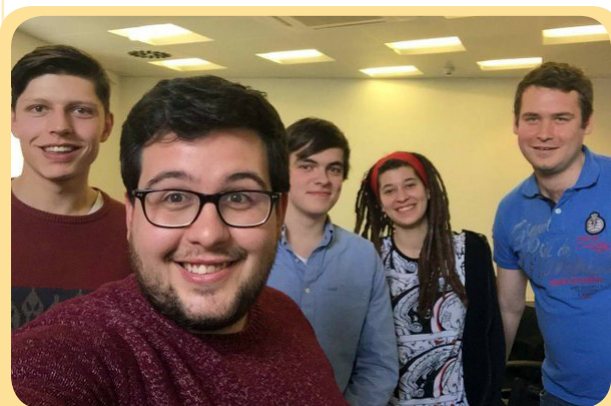
Briefing the delegates to get ready for the EUYC's – Thanks to Patrick Azevedo!

The EU Youth Conference is part of the 5th cycle of the Structured Dialogue – a unique participative process where young people contribute to EU youth policy.