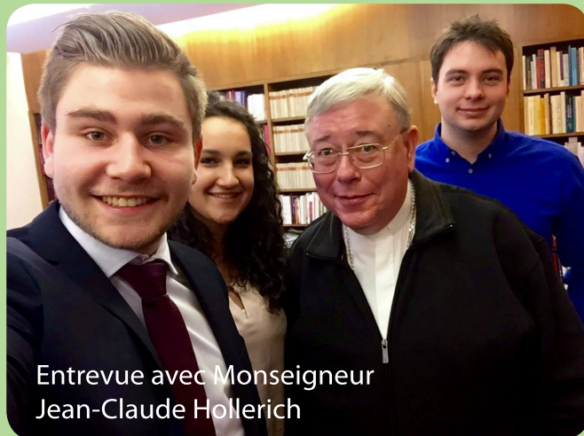
Entrevue avec Monseigneur Jean-Claude Hollerich