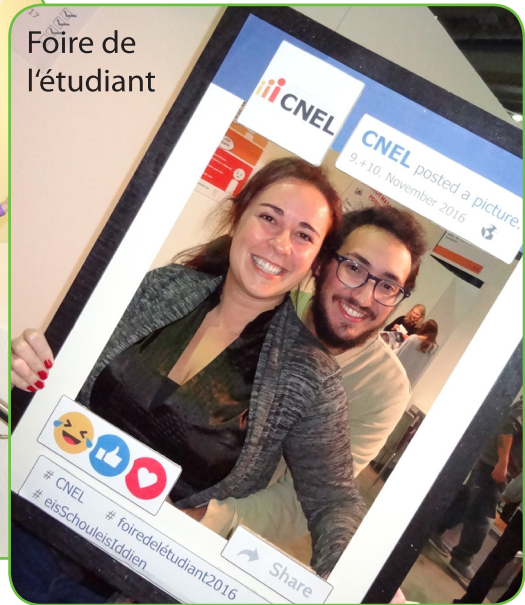
Foire de l'étudiant