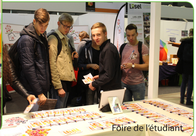
Foire de l'étudiant