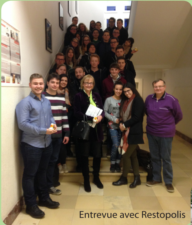
Entrevue avec Restopolis