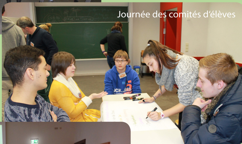
Journée des comités d'élèves