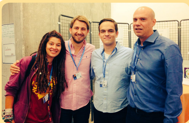
The EUYC Kosice delegation from Luxembourg

„I want to participate at the conference as it is a great opportunity to meet stakeholders, to empower youth and to make clear what youth, in all its versatility, represents and has to say in politics and on a general European level. Furthermore, it is great to have the opportunity to play a part in the structured dialogue and being able to represent a part of youth as a delegate.“