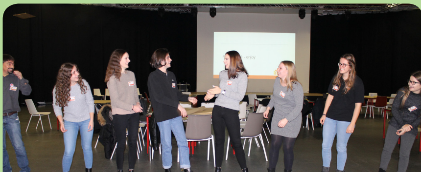
Journée des comités d'élèves

Il est important que la CNEL soit proche des besoins de ses comités d'élèves. C'est la raison pour laquelle une nouvelle tournée ou « touring » a débuté au mois de novembre et se poursuivra pendant le restant de l'année scolaire.