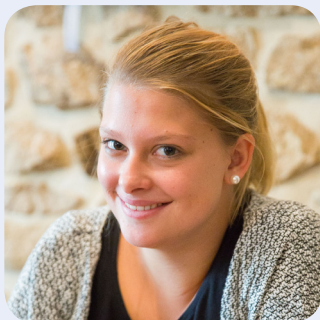
Djuna Bernard Présidente